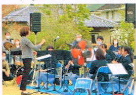
富士が丘ふれあいコンサート

全ての活動は多くの方の協力や支援があってはじめてできることです。そのことに気づき周りへの感謝の心を忘れずにいたいものです。この先12月には地域クリーンデーへの参加も予定しています。これからも地域の方との交流を大事にし、そこで学んだことを人生にいかしていきたいですね。