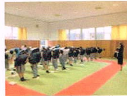
マナーアップ講座