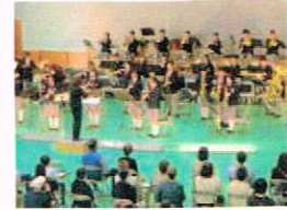
地域ふれあいコンサート