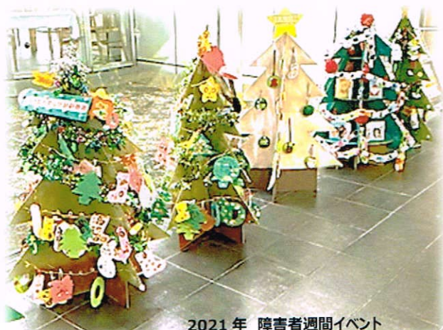
2021年 障害者週間イベント

新型コロナウイルス感染症の影響により、対面交流が難しい中、共通のテーマを持ちながらも各自が役割分担の元で制作活動を行うこととなりました。今年度は「雪だるま」を作ります。土台を学生やボランティア活動者が制作し、オーナメントづくり、飾りつけを各施設などで行い、総合福祉保健センターのギャラリーに展示します。来館者のみなさまにも自由に作品展示にご参加いただける「雪だるま」もご用意しております。ぜひ作品作りにご参加いただき、三田のちいさな共生社会「ともいき」を実感してください♪