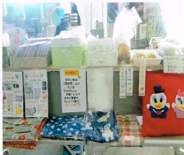
お菓子やグッズ販売もあります！