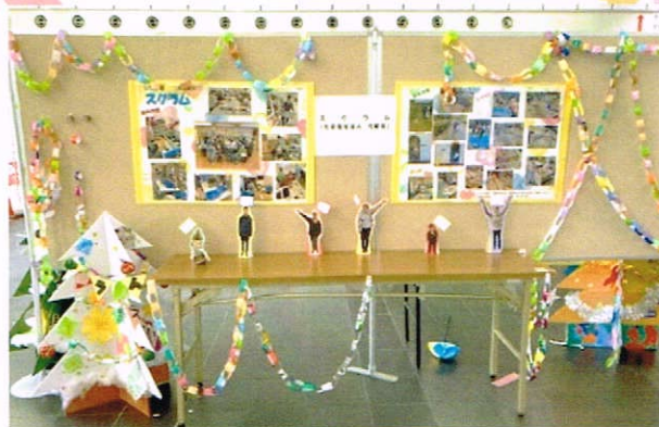
ボランティアとのコラボ作品や施設などの作品展示があります